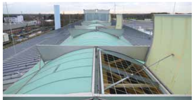
GRILLODUR® DSG in een dubbele klep

GRILLODUR® DS doorvalbeveiliging is gecertificeerd conform GS-BAU-18.