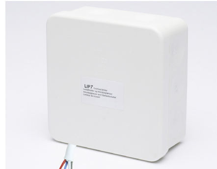
LIP7 OC Synchro