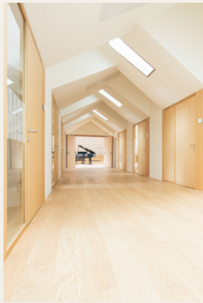
Schenker Salvi Weber Architekten