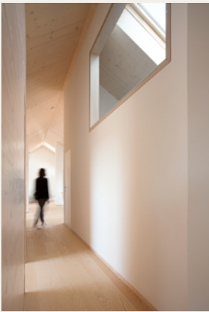
Architektur Strobl