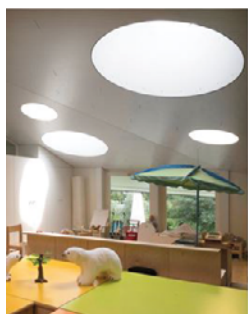
KIGA Binzmühle