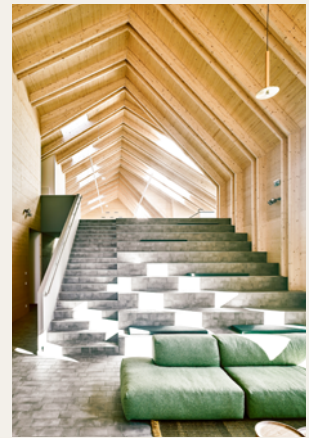
Smartvoll Architects