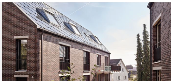
MFH Zürich