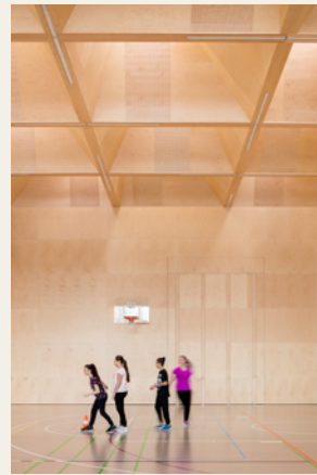
Dietrich Untertrifaller Architekten