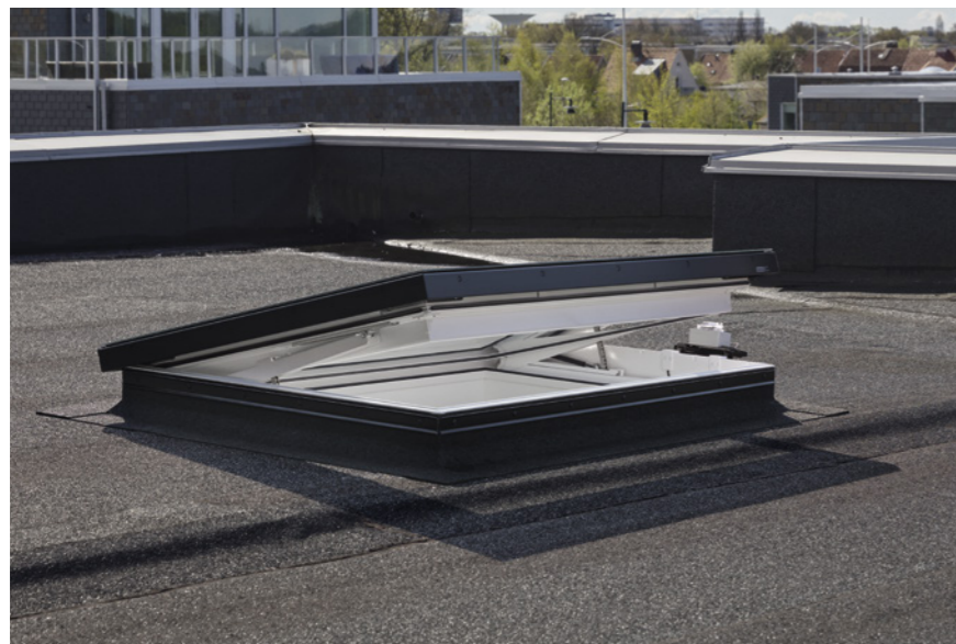
Fonction de ventilation

La commande s'effectue via le clavier mural intégré dans l'interrupteur à clé amovible. Quant au détecteur de pluie, il se charge de fermer automatiquement la fenêtre dès les premières gouttes de pluie.