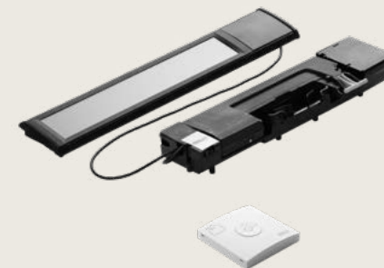
KSX napelemes motor