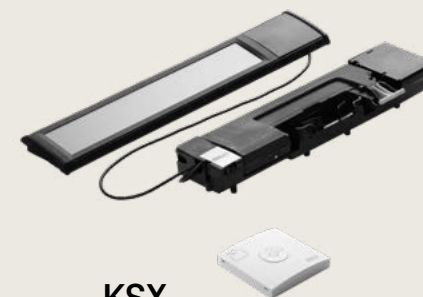
KSX napelemes motor