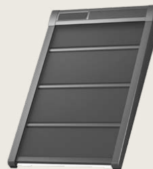
SSS napelemes külső hővédő- fényzáró könnyű redőny