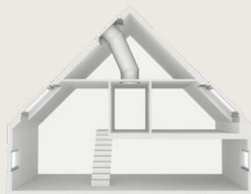
Merev csöves fénycsatorna magastetőbe