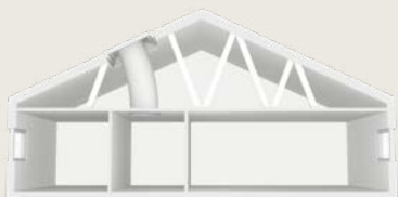
Flexibilis csöves fénycsatorna magastetőbe