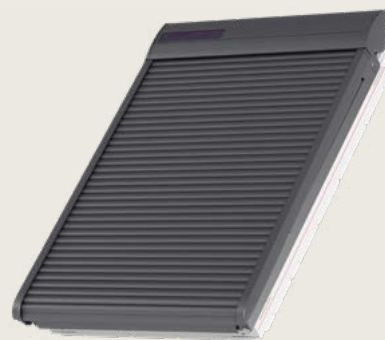
SSL napelemes külső hővédő- fényzáró alumínium redőny