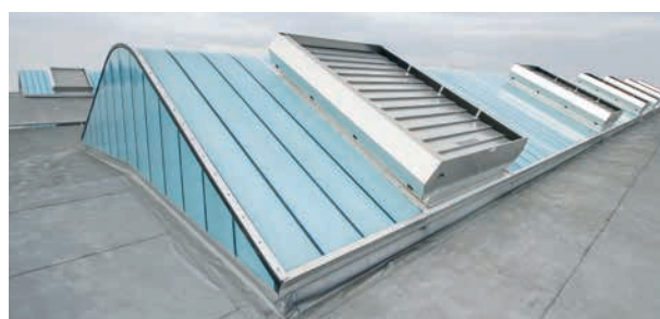
GRILLODUR® Sattellichtband mit Lüftungslamellen