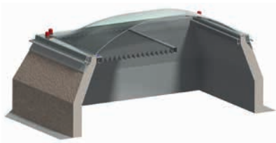
Lichtkuppel, starr mit Solarverschattung im Schnitt