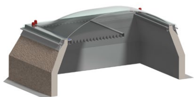
Vedere în secțiune a unei cupole luminoase cu protecție solară