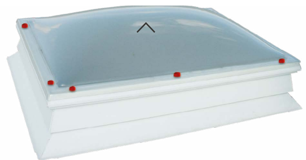
Hailstop, Super Top, PET-TOP

magas ütésállóságú fokozott vandalizmus elleni rezisztencia