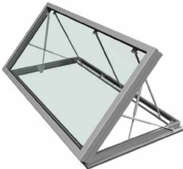
3D-tekening van een geopend VENTRIA TG-venster