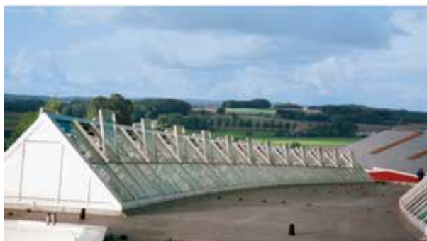
VENTRIA TG-venster geïnstalleerd om ventilatie in een zadeldak te bieden