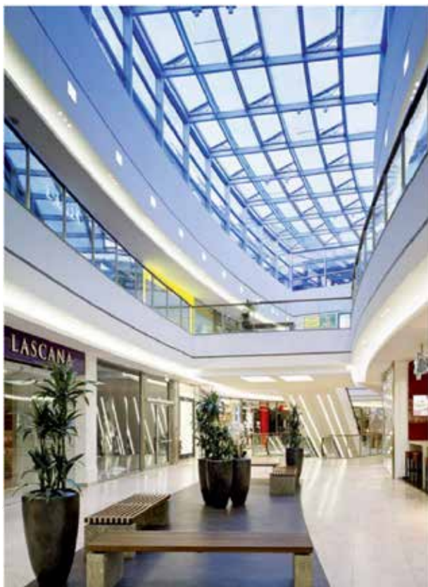
VENTRIA TG venster ingebouwd in lessenaarskap