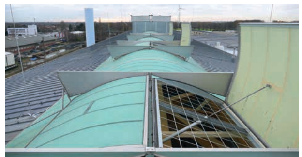
GRILLODUR® DSG in einer Doppelklappe

Mit der entsprechenden Zertifizierung gemäß GS-BAU-18, erfüllt die GRILLODUR® DSG-Durchsturz­sicherung die hohen Anforderungen der Berufsgenossenschaft der Bauwirtschaft.