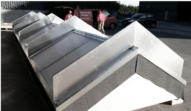
Eksempel på færdigmonterede vindskærme.

(I nogle tilfælde sidder oplukkefelterne dog sådan, at kun én vindskærm er nødvendig imellem dem). Følg venligst nedenstående montagevejledning: