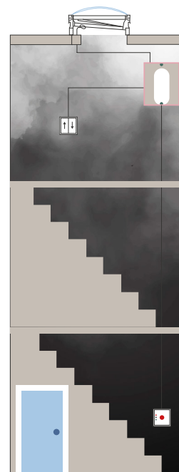
Røykventilasjon i trapperom