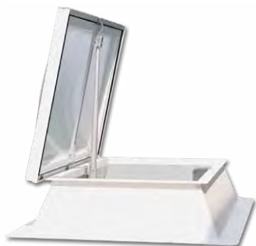
Lichtkuppel mit 24V-Rohrspindeltrieb