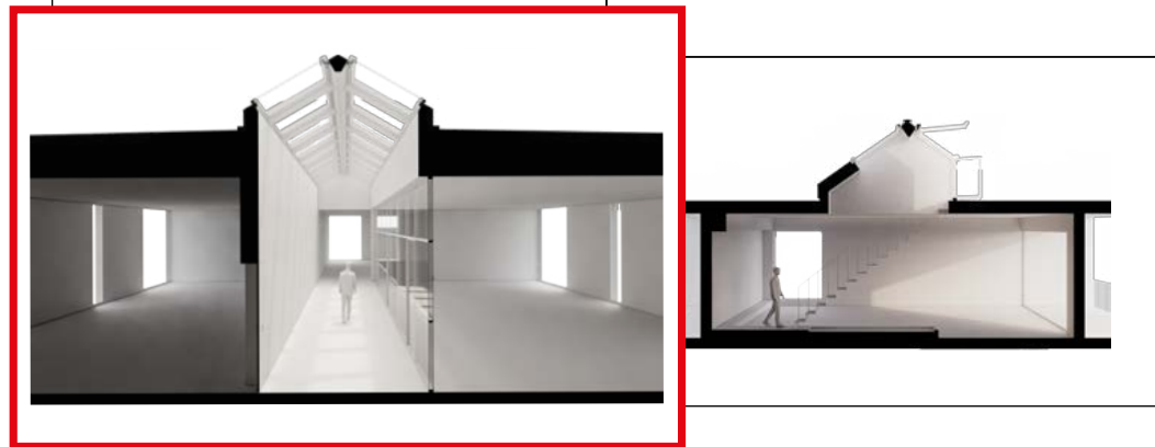
Lucernario a due falde